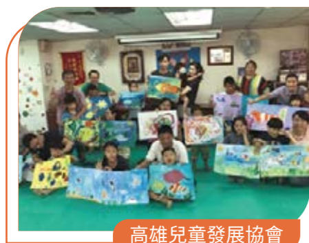
高雄兒童發展協會

因長期關懷偏鄉學童，社福會特別關注偏鄉中隔代教養、新住民、低收入戶等弱勢家庭，這些家庭的社經背景通常較為困難，且面臨社會、文化、自我適應、學習、語言等方面的挑戰，需要比一般學童獲得更多的社會支持與關懷。