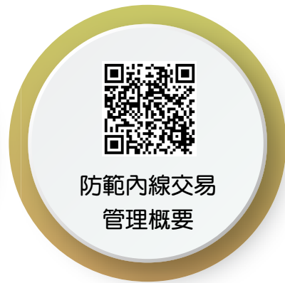
防範內線交易 管理概要