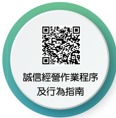
誠信經營作業程序 及行為指南