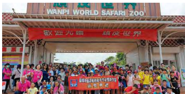
鼓勵課輔班學童，進行半日遊活動