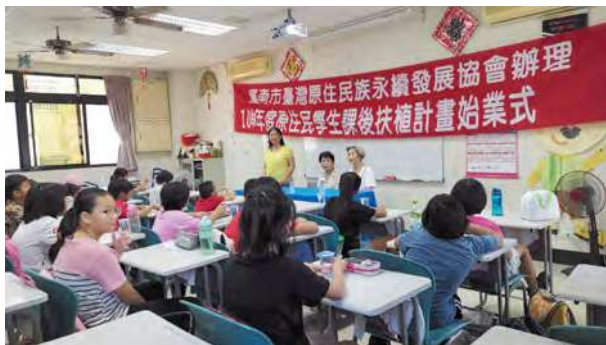
台南台灣原住民課輔班

2020 年世紀病毒來襲，迫使實體教室的教育輸送模式產生變化，也讓遠距輔導成為輸送的主流選項之一，有鑑於偏鄉地區、都市地區的學童在資訊教育的數位學習落差極大，加上疫情肆虐，有些都市學校啟動 E 化教學，但偏鄉學校及課輔班學生因資源較少，相對產生更大落差。為間接縮短城鄉數位落差，提升偏鄉學童的學習競爭力，2020 年 5 月起，社福會攜手統一企業將欲汰換的 30 台電腦回收整理，另購 15 台 19 吋螢幕贈送偏鄉課輔班。鑑於遠距輔導成為教育輸送的主流選項之一，再規劃與翰林文教基金會合作，提供課輔班 E 化課程。