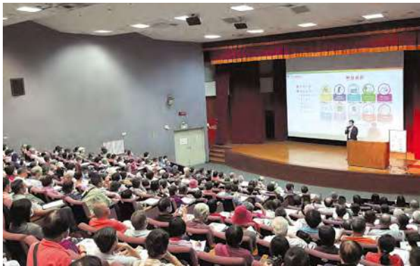
高雄科學工藝博物館講座現場