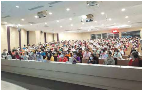
台中公共資訊圖書館講座現場

為提供民眾疾病防治新知與健康議題推廣，2020 年千禧之愛持續邀請專業醫師及教授辦理健康議題講座，在下半年於台北、台中及高雄共辦理 7 場預防醫學民眾講座，講題包括三高、失智、肺癌及腎臟病防治，另有健康油品、食安及塑化劑問題等食品營養講題，場場均獲熱烈迴響，共計約 1,900 人次參與。因應疫情及民眾吸收新知的管道逐漸轉為線上化，千禧之愛自下半年起於 Facebook 安排「名醫 / 營養師線上午餐會」網路節目，邀請醫師、營養師線上直播或錄製影片播出，藉此打破地域之限制，讓無法參與實體講座的民眾亦能聽講。