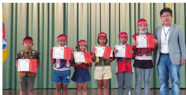
鼓勵課輔班學童，提供進步學童獎學金