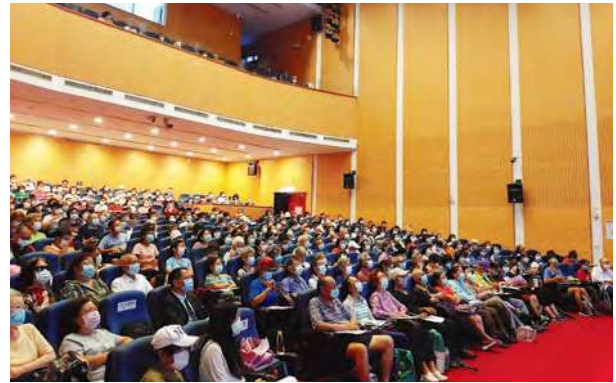
台北中正紀念堂講座現場