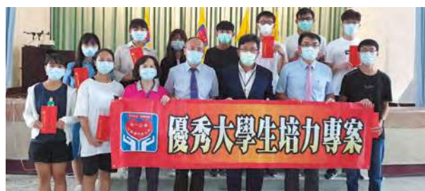
2020 年第 5 屆

社福會為鼓勵暨栽培清寒家庭優秀大學生，讓優秀學子於大學期間能專心學習，並感念受助繼而回饋社會，2016 年開始每年頒發獎學金予家境清寒之優秀大學生。每年受惠 40 名大學生，投入 1,960 仟元